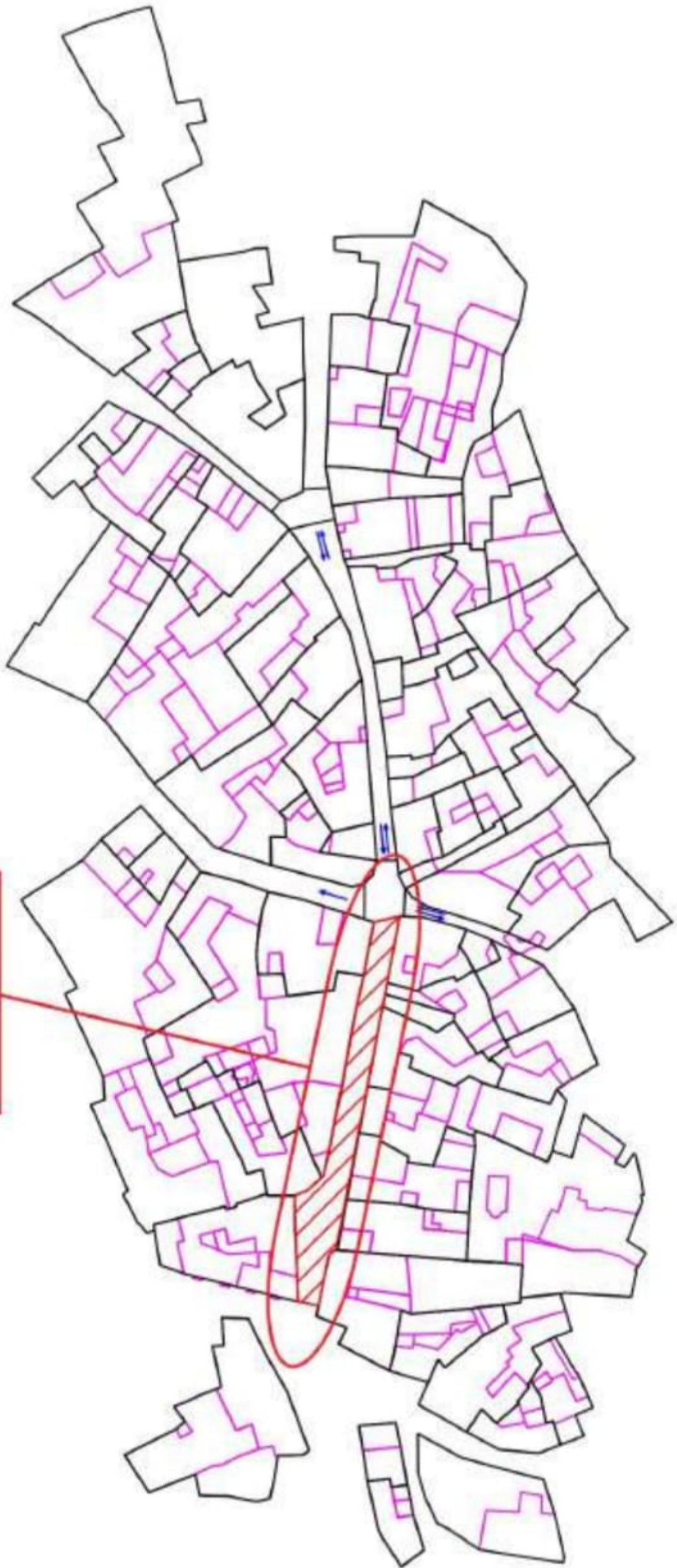
PLANO EJECUCIÓN FASE I