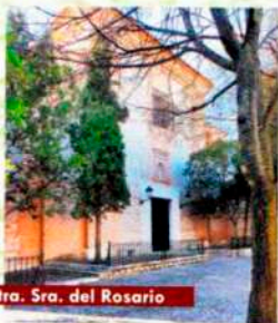
Ermita de Ntra. Sra. del Rosario

El fervor religioso de Chinchón y la costumbre de advocar los barrios a los diferentes santos se refleja en la existencia de varias ermitas entre las que se han seleccionado estas cuatro que reúnen un interesante patrimonio artístico y cultural.