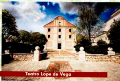
Teatro Lope de Vega

Llama la atención en su interior un gran lienzo con la imagen de la localidad que hace de telón.