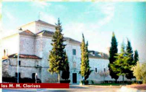
Convento de las M. M. Clarisas

Construida entre los siglos XVI y XVII esta iglesia de grandes proporciones, se yergue majestuosa en lo alto presidiendo la vida del pueblo.