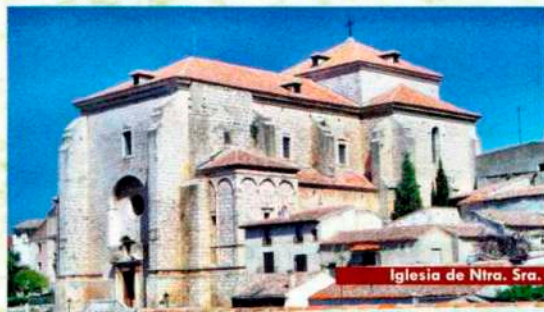
Iglesia de Ntra. Sra. de la Asunción

Subiendo desde la Plaza Mayor por una angosta calle empedrada llegamos a la Iglesia Parroquial de Ntra. Sra. de la Asunción.