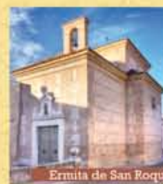
Ermita de San Roque