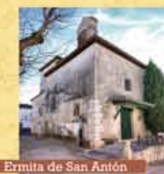
Ermita de San Antón

El fervor religioso de Chinchón y la costumbre de advocar los barrios a los diferentes santos se refleja en la existencia de varias ermitas entre las que se han seleccionado estas cuatro que reúnen un interesante patrimonio artístico y cultural.