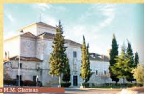
Convento de las M.M. Clarisas

Construida entre los siglos XVI y XVII esta iglesia de grandes proporciones, se yergue majestuosa en lo alto presidiendo la vida del pueblo.