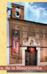
Ermita de Ntra. Sra. de la Misericordia