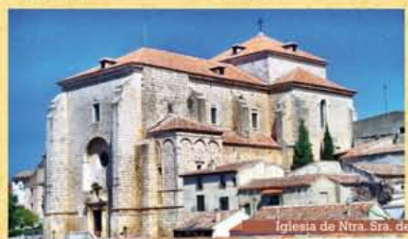
Iglesia de Ntra. Sra. de la Asunción

Subiendo desde la Plaza Mayor por una angosta calle empedrada llegamos a la Iglesia Parroquial de Ntra. Sra. de la Asunción.