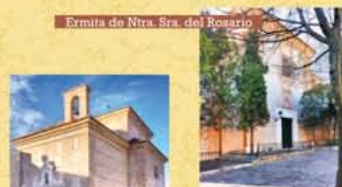
Ermita de Ntra. Sra. del Rosario