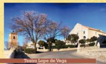
Teatro Lope de Vega

En el solar que fue del palacio de los Condes, se encuentra el Teatro Lope de Vega, construido en 1891 por la Sociedad de Cosecheros. Llama la atención en su interior un gran tapiz con una imagen de la localidad que hace las veces de telón.