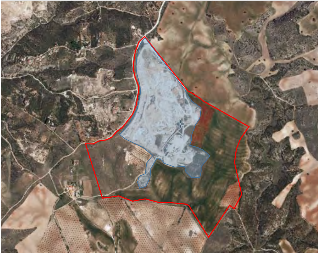
Figura 9.- Fotograma aéreo de 2009 de la zona de explotación La Jara.

Desde el fotograma de 2011, en el que se aprecia un ligero aumento de la extensión de la actividad hacia el este respecto a 2009, no se aprecian cambios que indiquen que se han llevado a cabo actividades en el emplazamiento.