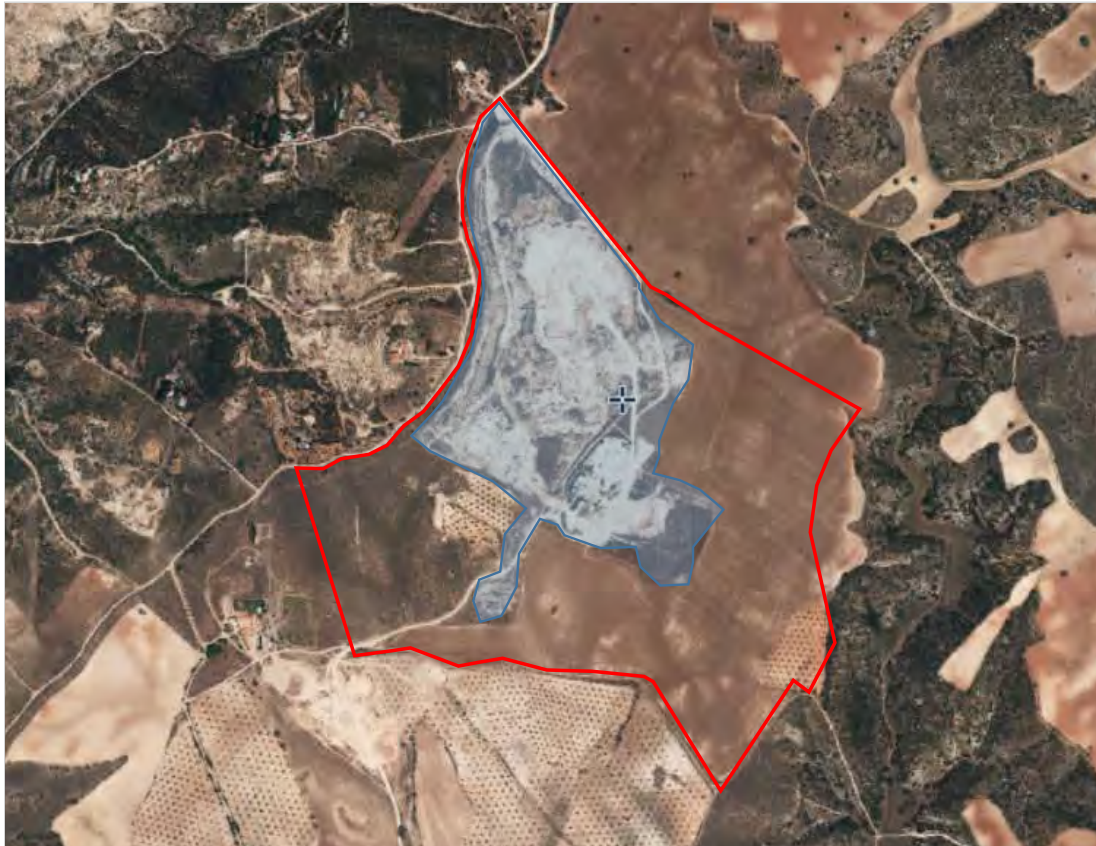
Figura 10.- Fotograma aéreo de 2011 de la zona de explotación La Jara.