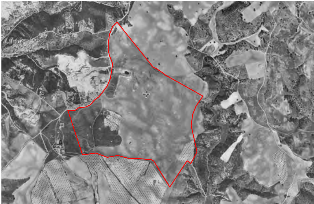
Figura 6.- Fotograma aéreo de 1997 de la zona de explotación La Jara.