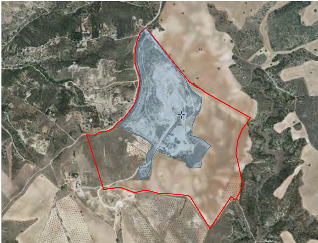
Figura 11.- Fotograma aéreo de 2014 de la zona de explotación La Jara.