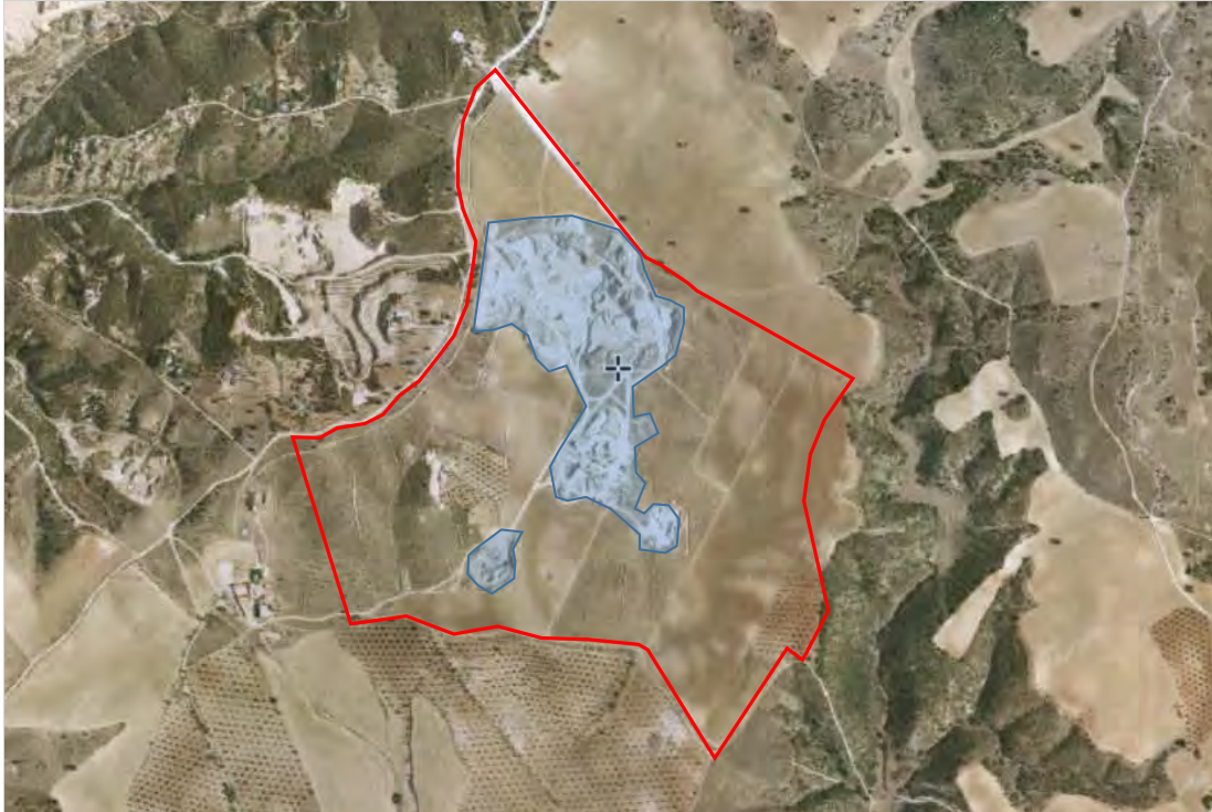
Figura 7.- Fotograma aéreo de 2003 de la zona de explotación La Jara.

Es en el fotograma de 2003 donde comienza a apreciarse que la actividad minera en el ámbito de La Jara, señalada en trama azul sobre el fotograma. En este momento abarca algo menos de la cuarta parte del total del emplazamiento, y se aprecian tanto zonas de excavación como áreas de acopio de estériles sobre el terreno.