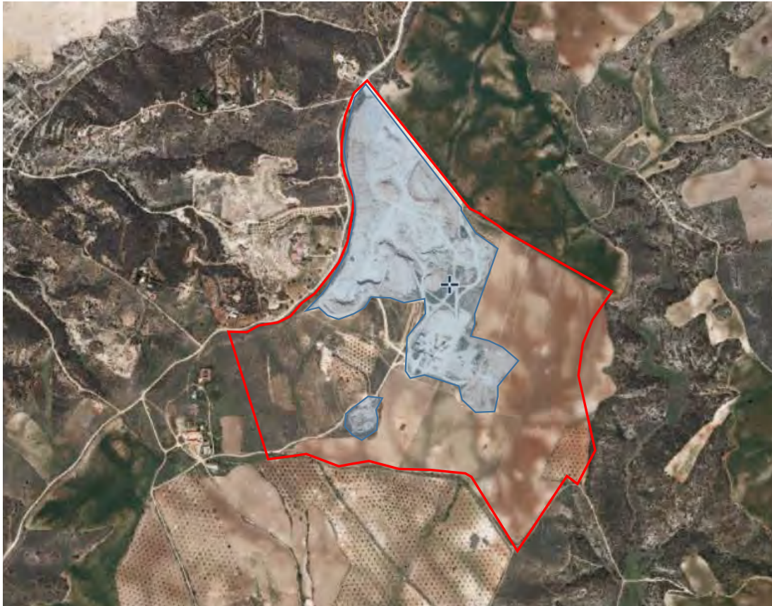
Figura 8.- Fotograma aéreo de 2006 de la zona de explotación La Jara.

En el fotograma de 2009 se aprecia cómo la actividad extractiva sigue creciendo, si bien a un ritmo menor que en los años anteriores. En este momento ocupa por lo menos un tercio del total de la superficie del ámbito y adopta una forma más regular hacia el sur, indicando que ha alcanzado su límite productivo por este lado. En el entorno del emplazamiento no se aprecian cambios destacables.